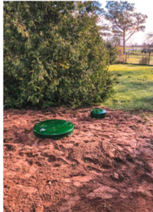
„AFS Baltic“ specialistai užsiima inžinerinių tinklų statyba ir įrenginių prekyba.